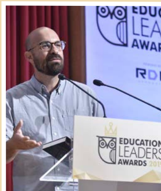
Τιμητικό Βραβείο Α. Πατοσιάς

βραβείο Fields, για εξαιρετικές συνεισφορές στα μαθηματικά θεμέλια των επιστημών πληροφορικής.